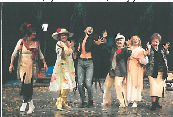
Obrázok 8 – Najstaršie remeslo