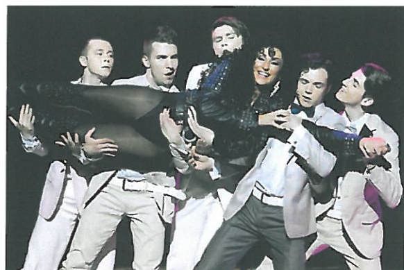
Obrázok 4 - Hairspray