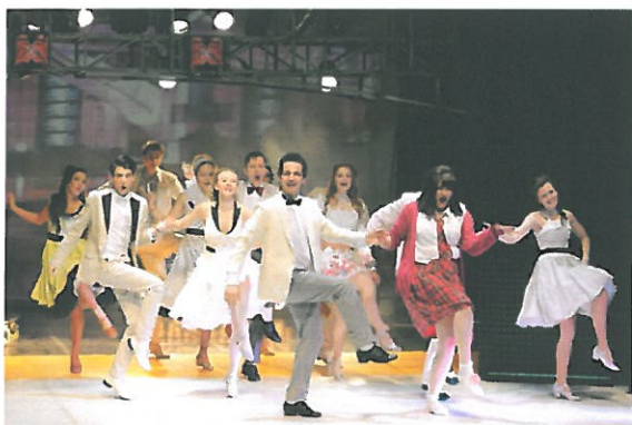
Obrázok 3 - Hairspray

Muzikál je plný humoru, retro pesničiek aj náročných choreografií, v rýchlych tempe sa striedajú scény citlivé, vtipné, komorné aj plné tanca a energie zo života.