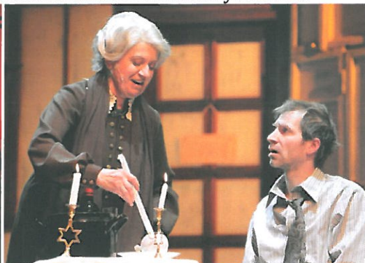
Obrázok 2 - Obchod na korze