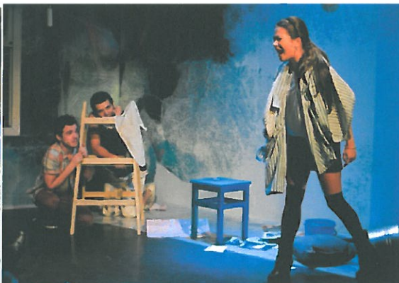
Obrázok 6 – Ako zbalit' babu: foto: Ctibor Bachratý