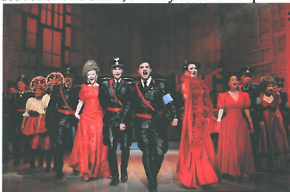
Obrázok 1 - Obchod na korze

Dej muzikálu sa odohráva v júni roku 1942, teda v období, kedy sa novovzniknutý Slovenský štát prostredníctvom Hlinkových gárd podieľal na deportácii židovských občanov zo Slovenska. Muzikál je tragikomickým príbehom jednoduchého stolára Tóna Brtka, ktorý sa vďaka svojmu švagrovi, miestnemu veliteľovi Hlinkovej gardy, stáva arizátorom a získa skrachovanú galantériu, patriacu staršej židovskej vdove Rozálii Lautmanovej. Tematizuje schopnosť autoritatívneho režimu zatahnuť do svojho súkolia aj bezúhonného človeka, ktorý sa potom márne snaží vyrovnať s výčitkami vlastného svedomia. Tlak udalostí dovedie Tóna Brtka k hraničnej životnej situácii. Cez príbeh obyčajného stolára Tóna Brtka rozvíja podobenstvo o zodpovednosti človeka nielen za svoj život, ale aj za životy ľudí okolo neho, príbeh o zvlčivosti doby, ktorá vôbec nemusí byť len minulosťou, ale ktorá sa znovu a znovu vracia v rôznych podobách aj v súčasnosti. A je len vecou svedomia každého súčasníka, či sa k takýmto reinkarnáciám fašizmu či nacizmu či národného socializmu či klérofašizmu postaví zoči - voči alebo sa otočí chrbtom...Obchod na korze je o zlyhaní ľudského charakteru, ale aj celej spoločnosti. Otvára temné obdobie a zároveň vedome nepriznávané dedičstvo Slovenského štátu, s ktorým sa naša spoločnosť doteraz celkom nevyrovnala.