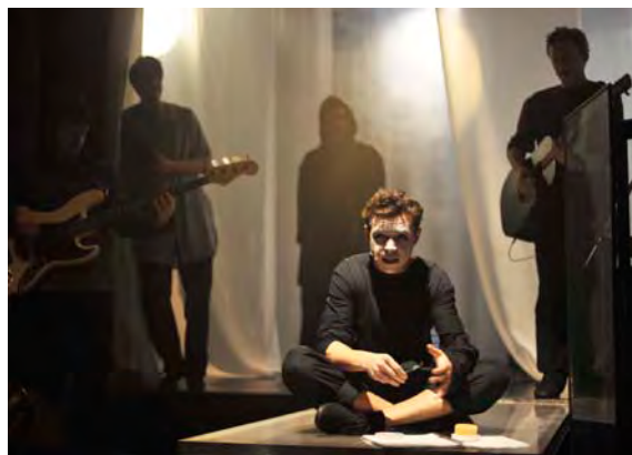
Obrázok 4 DOTYKY