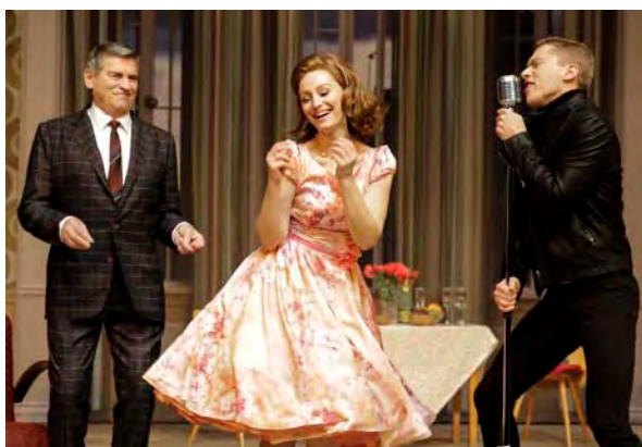
Obrázok 1 SLUHA DVOCH ŠÉFOV

Píše sa rok 1960 a dôverčivý Francis Henshall sa dostane do služieb dvoch pánov: Roscou Crabba a miestneho gangstra Stanlyho Stubbersa. Zo všetkých síl sa snaží zabrániť ich stretnutiu, aby sa nedozvedeli, že pracuje pre oboch z nich. Vyjde však najavo, že Roscoe je v skutočnosti Rachel Crabbeová, preoblečená za svojho brata-dvojča, ktorého zabil práve Stanley Stubbers. Tým sa roztáča kolotoč vtipných zámien, komediálnych prekvapení a humorných scén.