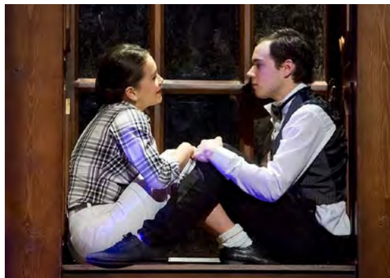
Obrázok 6 EQUUS