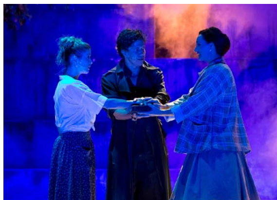
Obrázok 8 POKRVNÍ BRATIA