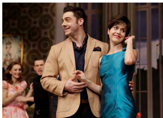
Obrázok 2 SLUHA DVOCH ŠÉFOV