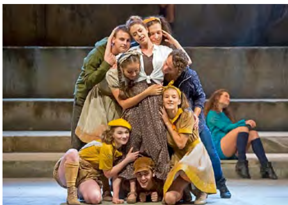
Obrázok 7 POKRVNÍ BRATIA

Kultový anglický muzikál Willyho Russella rozpráva príbeh dvoch bratov-dvojčiat Mickeyho a Eddieho, ktorých matka hneď po narodení rozdelila, aby sa dokázala postarať o svoje ostatné deti. V nádeji na lepší život dala jedného z chlapcov na výchovu do bohatej, no bezdetnej rodiny svojho zamestnávateľa. Eddie tak vyrastal v materiálnom blahobyte a získal dobré vzdelanie, kým Mickey, ktorý zostal s matkou a súrodencami, sa v biednych pomeroch pretľkal zo dňa na deň. Príroda je však silnejšia ako spoločenské pomery a z chlapcov sa napriek tomu, že vyrastajú v rozdielnom sociálnom prostredí, stanú najlepší priatelia – pokrvní bratia. Nad verným priateľstvom ale visí ponurá veštba, ktorá vraví, že keď sa bratia dozvedia svoj skutočný pôvod, stihne ich nešťastie. A svojmu osudu nemôže uniknúť nikto.